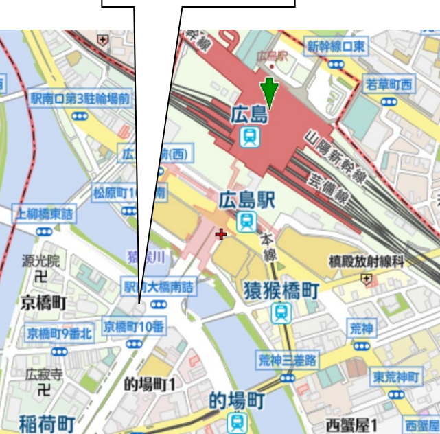
大樹生命広島駅前ビル