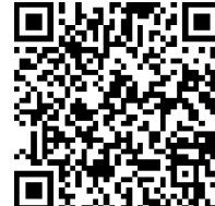
大樹生命静岡駅前ビル