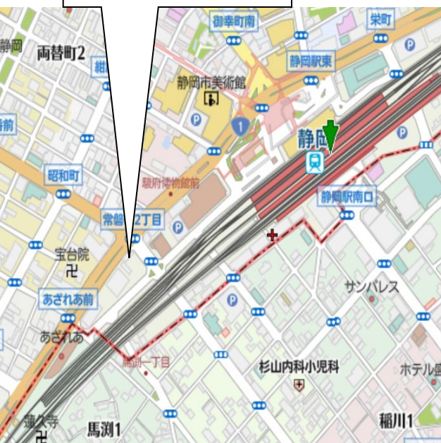
大樹生命静岡駅前ビル