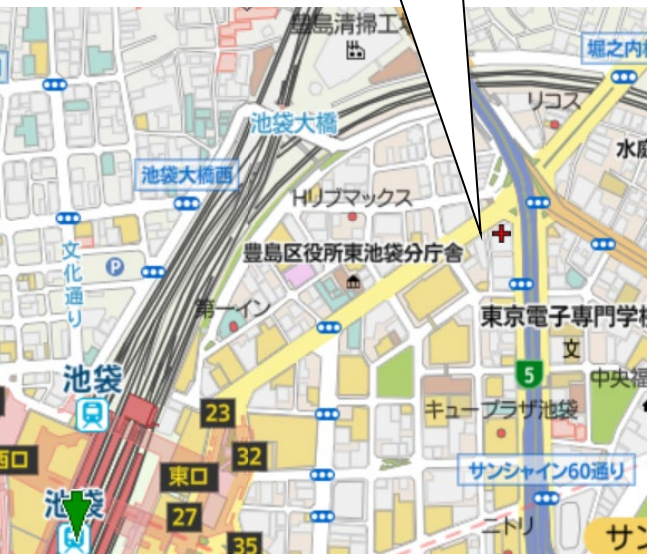
大樹生命池袋ビル