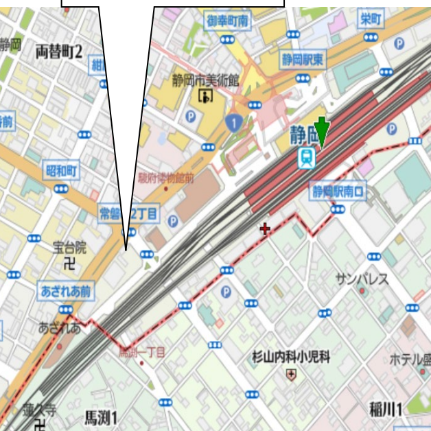
大樹生命静岡駅前ビル