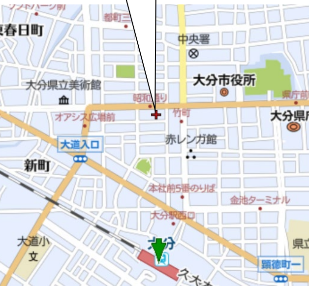
大樹生命大分ビル