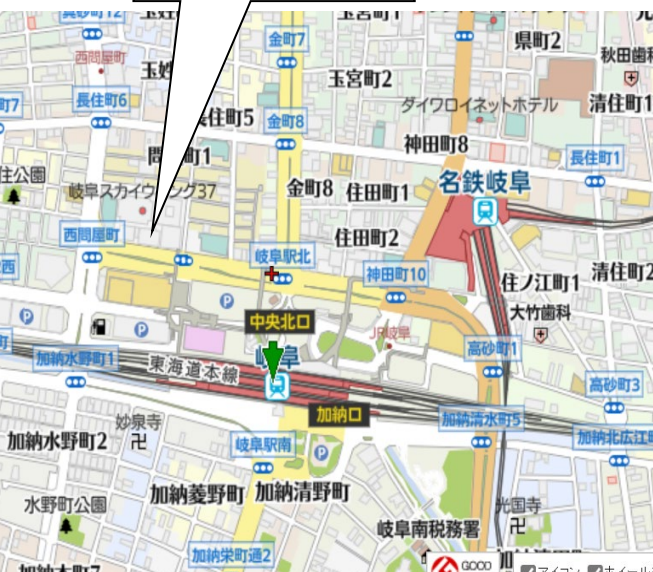
大樹生命岐阜駅前ビル