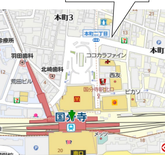
大樹生命国分寺ビル