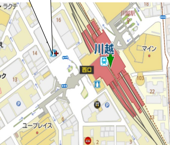
大樹生命川越駅前ビル