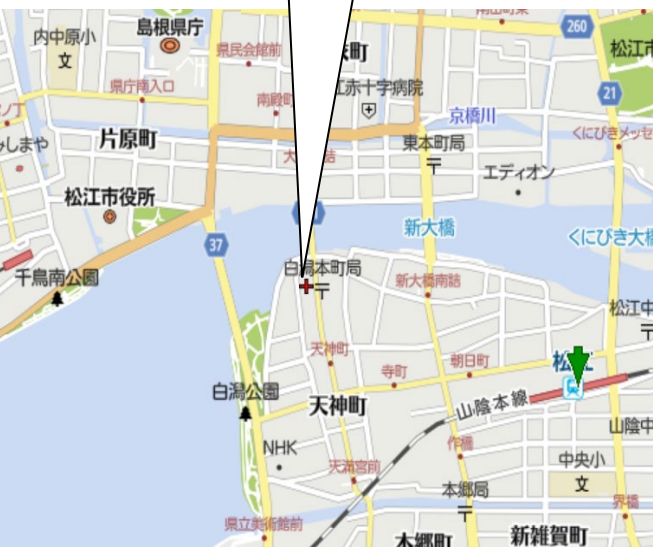
大樹生命松江ビル