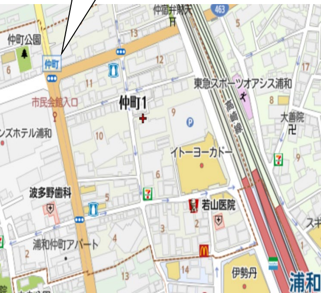
大樹生命浦和ビル