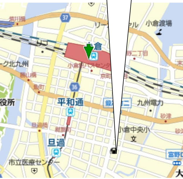
大樹生命北九州小倉ビル