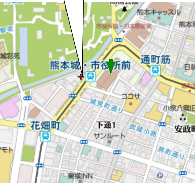
大樹生命熊本ビル